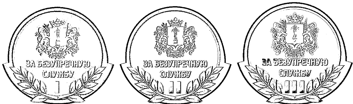
РИСУНОК почётного знака Губернатора Ульяновской области «За безупречную службу»

Знак I степени изготавливается из серебра с позолотой, Знак II степени – из серебра, Знак III степени – из латунного сплава цвета бронзы.